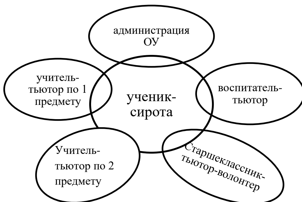
Рис. 7. Система тьюторской поддержки учащегося-сироты.

активного взаимодействия с заинтересованными взрослыми, сверстниками разного возраста любому ребенку, а ребенку-сироте особенно, трудно добиться значимых результатов. Наш опыт показал, что для их достижения в отношении ребенка-сироты должна быть выстроенная система комплексной тьюторской поддержки, координируемая и направляемая администрацией школы и детского дома. Поэтому в нашей модели поддержки задействованы все субъекты образования: администрация ОУ, учителя-тьюторы, воспитатели-тьюторы, а также старшеклассники-волонтеры, которые выполняют разные функции в социализации ребенка-сироты в образовательном процессе. Она представлена на рис. 7.