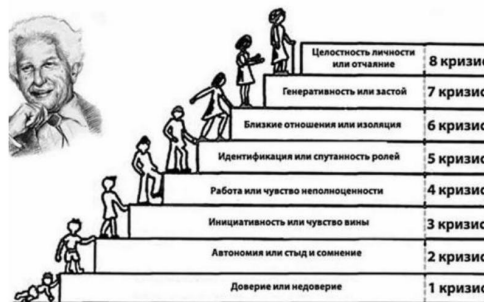
Возрастные кризисы по Э. Эриксону

5. Игра заканчивается, когда все участники пройдут все игральные поля.