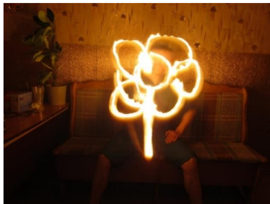
Фото 2 «Грани моего Я»