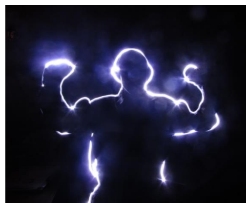
Фото 4 «Я глазами других»

Для выявления экспериментального сдвига мы воспользовались методами математико-статистической обработки данных. В данном случае использовался непараметрический метод – Т-критерий Вилкоксона.