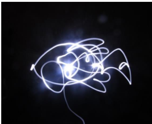
Фото 1 «Метафорический портрет»