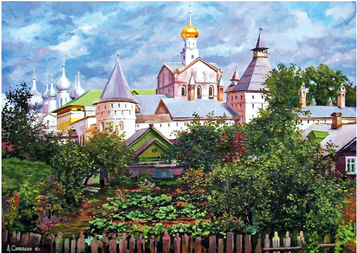
А.П. Самохвалов «Ростов Великий»