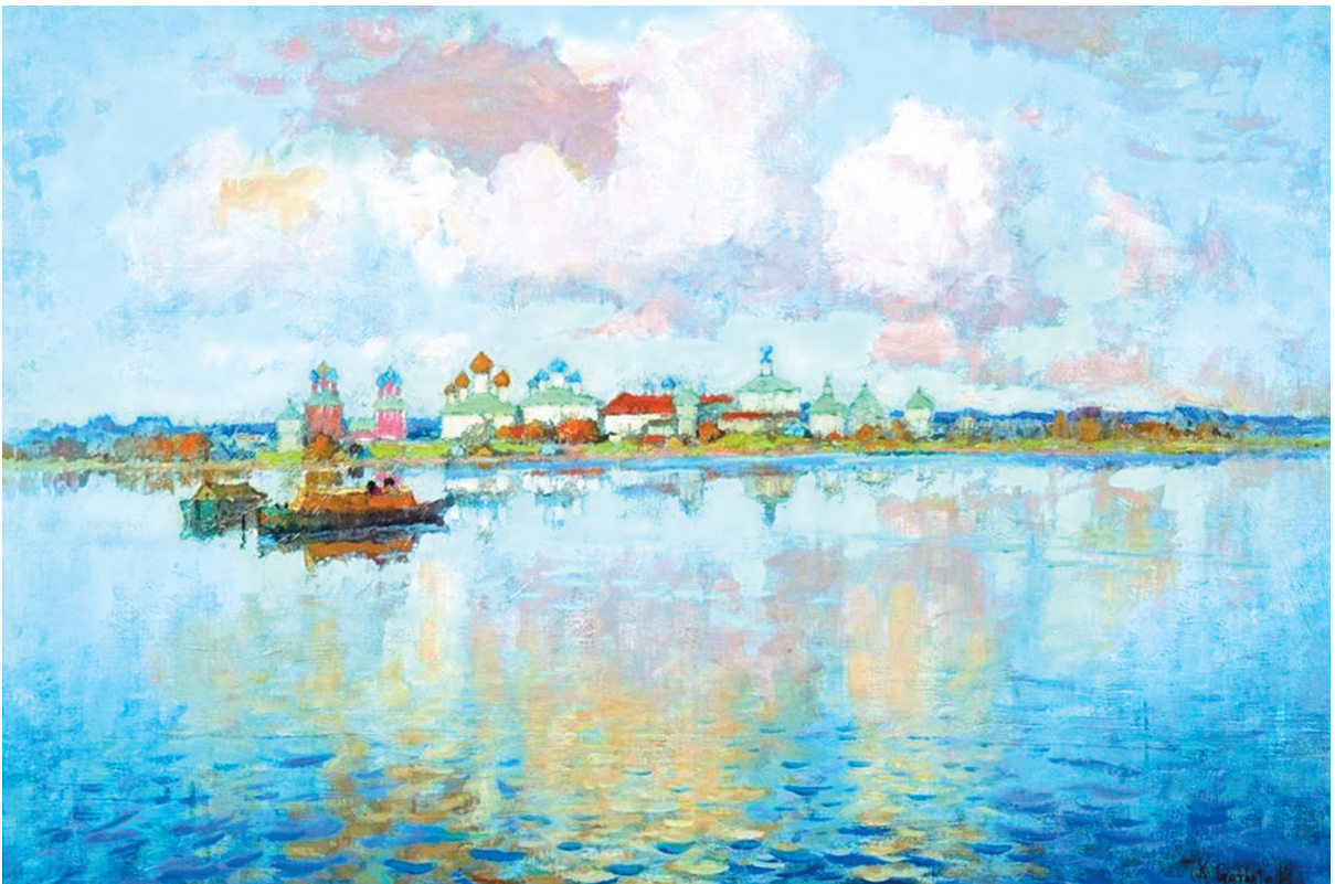
К.И. Горбатов «Ростов Великий. На озере Неро»