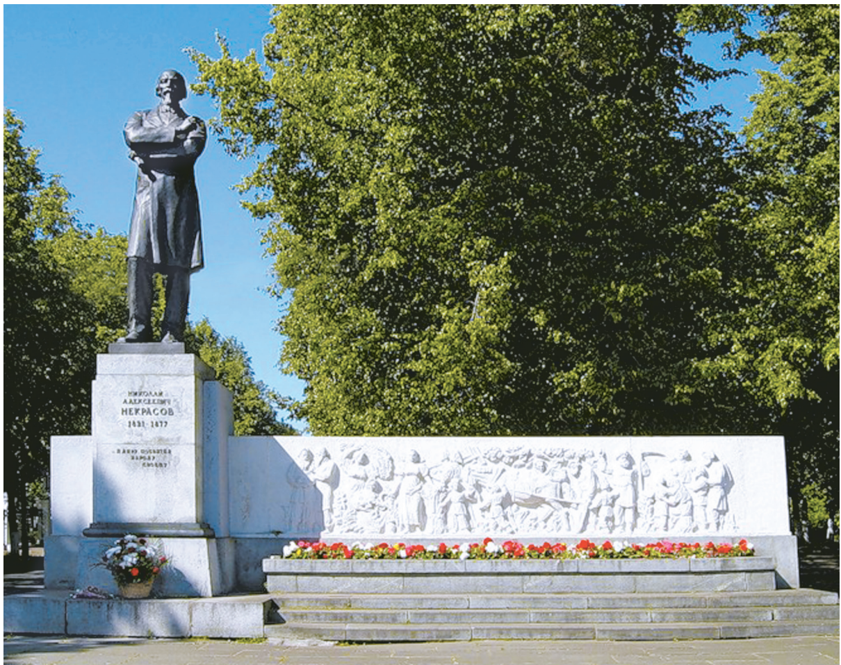
Памятник Николаю Некрасову в Ярославле