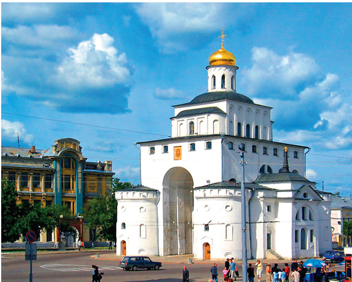
Вид на Золотые ворота во Владимире