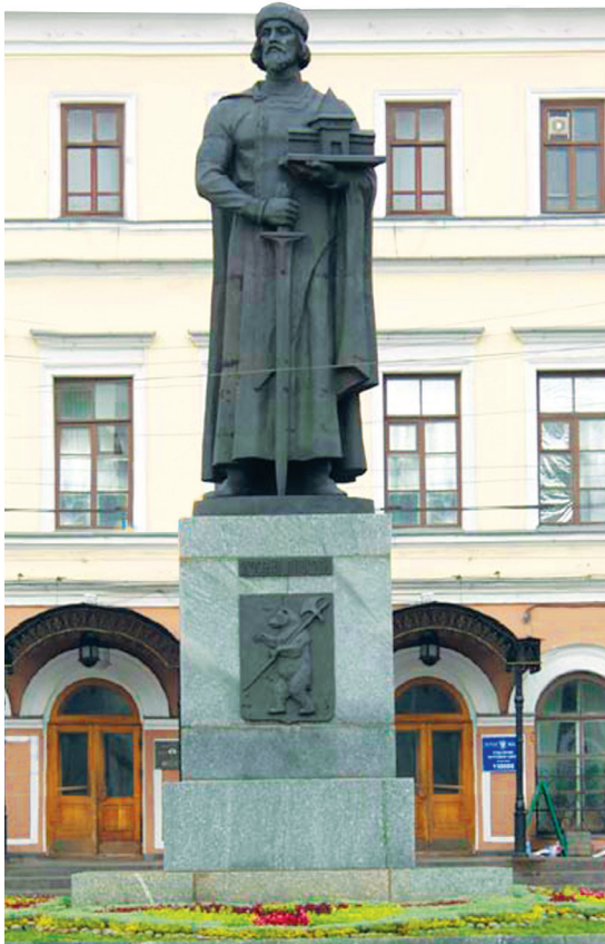
Памятник Ярославу Мудрому в Ярославле