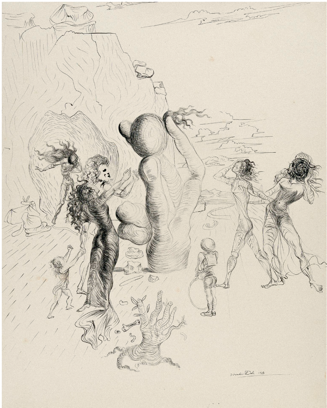
Сальвадор Дали «Превращение Нарцисса»

«Тьмы низких истин мне дороже нас возвышающий обман...» (А.С.Пушкин, 1830, «Герой»)